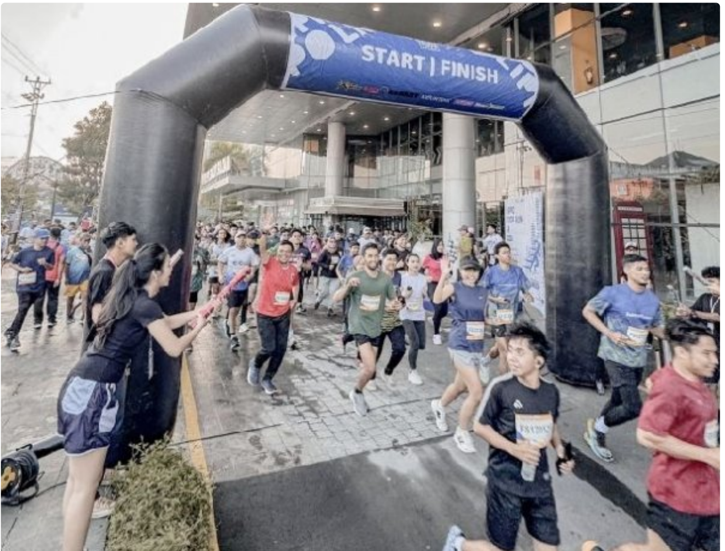
Even Lippo Loop Run 2024 yang digelar oleh Thumbuh Agency UAJY bersama Lippo Plaza Jogja dan XGym, Minggu (8/12/2024)/Foto: Thumbuh Agency UAJY.

Sleman - Thumbuh Agency Universitas Atma Jaya Yogyakarta (UAJY) bersama Lippo Plaza Jogja dan XGym sukses menggelar Lippo Loop Run 2024, sebuah